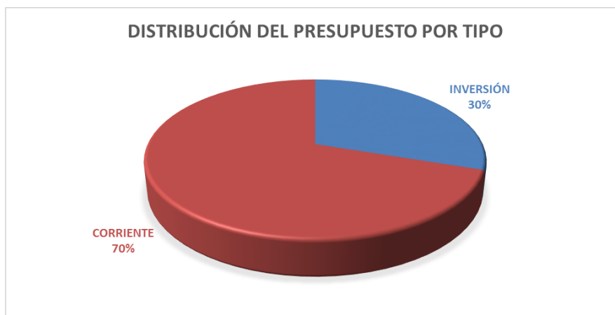
Gráfico N° 1: Distribución del presupuesto por tipo de Gasto 2022